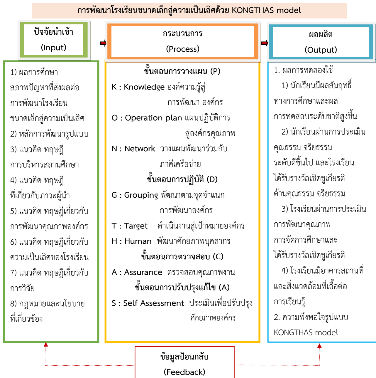
ภาพที่ 4.2 ภาพกระบวนการดำเนินการพัฒนาโรงเรียนขนาดเล็กสู่ความเป็นเลิศด้วย KONGTHAS model