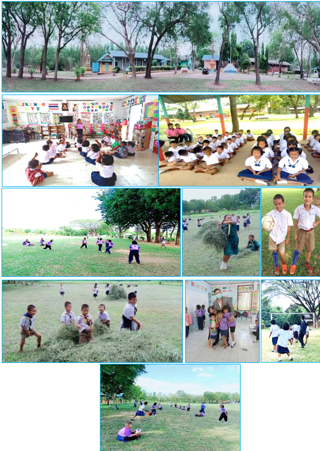
ภาพที่ 4.3 ภาพการพัฒนาสถานศึกษา